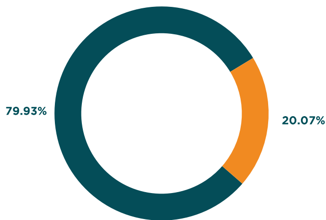
Por tipo de Activo Inmobiliario

■ Inmueble ■ Depósitos a la Vista ■ Fondo Cerrado