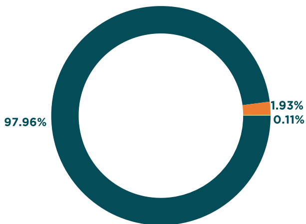
Por tipo de Activo

■ Inmueble ■ Depósitos a la Vista ■ Fondo Cerrado