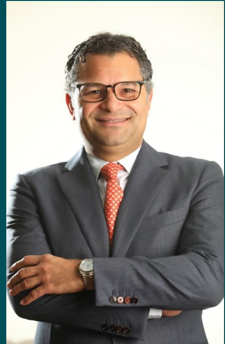
Alberto Y. Cruz Presidente

El favorable entorno económico nacional promovió que el 2019 fuera un año de crecimiento y consolidación para el mercado de valores. La Superintendencia del Mercado de Valores continuó trabajando en el fortalecimiento del marco legal con la aprobación del Reglamento para los Intermediarios de Valores, el Reglamento de Gobierno Corporativo, el Reglamento de Oferta Pública, entre otros. El crecimiento y fortalecimiento constante del mercado de valores de nuestro país provee un escenario de oportunidades para los participantes y, de manera especial, para los inversionistas personales, empresariales e institucionales.